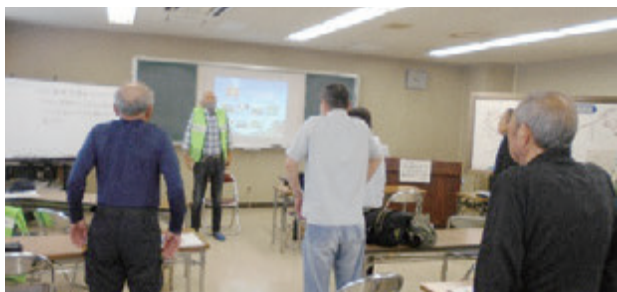
筋トレ・脳トレプログラム