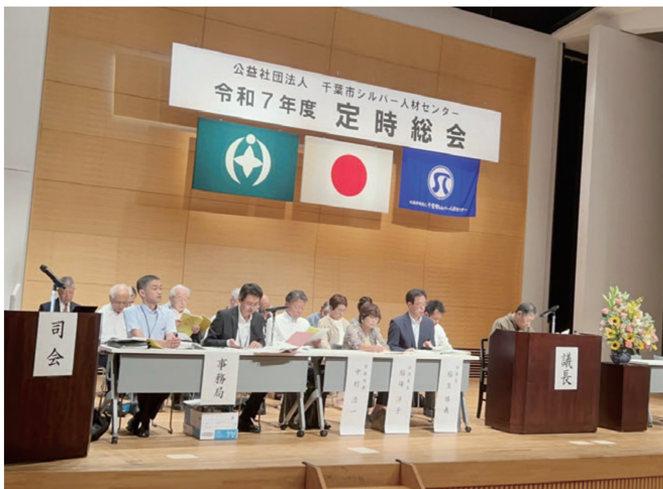
千葉市生涯学習センター2階ホール

令和7年度定時総会を6月26日（木）に千葉市生涯学習センター2階ホールにて開催しました。