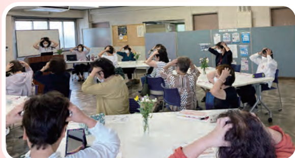
みんなで頭皮マッサージ

10月5日（木）に花王のスタッフをお迎えして、ヘアケア講座を開催しました。 前半は、髪と頭皮の基礎知識からスタート！！ 正しい髪の洗い方や、頭皮マッサージ方法について、実践方式で楽しく学びました。 後半はヘアカラーについて、白髪染めの種類や特徴を学ぶとともに、スマートフォンを利用した髪色診断を行いました。 アプリをダウンロードし、カメラを覗くと…なんと瞬時に似合う髪色を選んでくれます。 これにはみなさんビックリ！！ 終始和やかに「ヘアケア」について楽しく学ぶ事が出来ました。