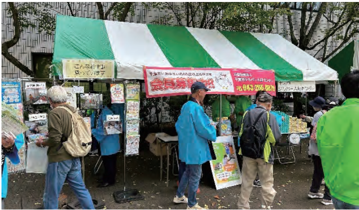
若葉区民まつり 11月5日(日)