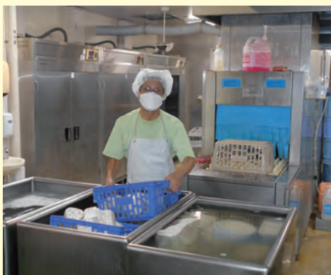
永さんの就業中の様子

徳之島では80歳まで働くつもりだったという永さん、職場は変わってもその目標は変わらないだろうと確信させるお話しぶりでした。