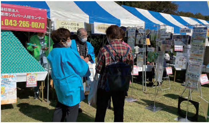
花見川区民まつり 10月22日(日)

地域住民の方への感謝を込めて、シルバー人材センター末広事務所周辺の清掃を行いました。20名の参加者が集まり、3方面に分かれて、活動を開始しました。各自大量のゴミを集めて戻ってきて、充実した清掃活動となりました。 実施日：10月18日（水）