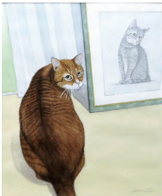
宿松 洋次 『この絵が、僕なの？』