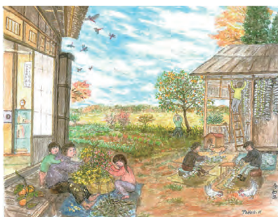
早川 武夫 『里の秋』